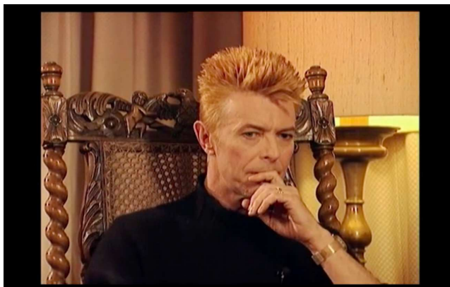
Filmstill: „Why Are We Creative?“ David Bowie 1997

DAVID BOWIE, MARINA ABRAMOVIC, QUENTIN TARANTINO, BLIXA BARGELD, AI WEI WEI, BJÖRK, NICK CAVE, OLIVIERO TOSCANI, VIVIENNE WESTWOOD, ANGELINA JOLIE, NELSON MANDELA, BONO, STEPHEN HAWKING, DAMIEN HIRST, JEFF KOONS, RUSS MEYER, JOHN CLEESE, NEO RAUCH, JIMMY PAGE, YOKO ONO u.v.m.